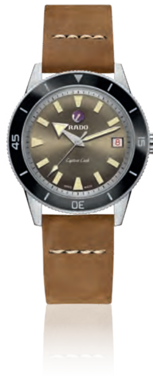
CAPTAIN COOK Limited Edition Edelstahl, Hightech-Keramik-Lünette, Saphirglas, Datum, Automatik, im Limited-Etui · 2.110,- €