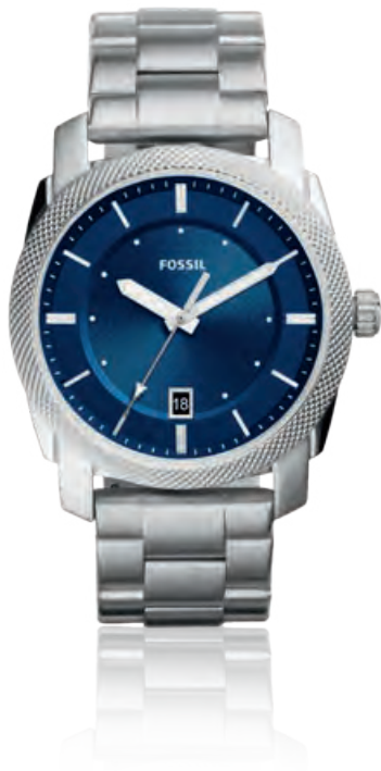
MACHINE Edelstahl, Datum, Quarz · 109,- €