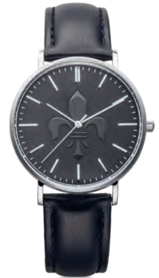
FULDA-Uhr 36MM Edelstahl, Quarz · 79,- €

Für das schmalere Handgelenk gibt es auch eine Fulda-Uhr mit goldfarben beschichtetem Edelstahlgehäuse und einem Durchmesser von 36 mm. Vom Verkaufspreis gehen 10 € an die Spendenaktion der Fuldaer Zeitung zugunsten sozialer Projekte in der Heimatregion von Juwelier Bott.