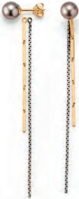
Ohringe FUSE BY JASMINA JOVY Tahitiperlen 7–8 mm, Sterlingsilber · 525,- €