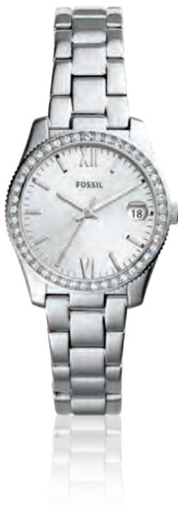
SCARLETTE Edelstahl, Datum, Zirkonia, Quarz · 109,- €