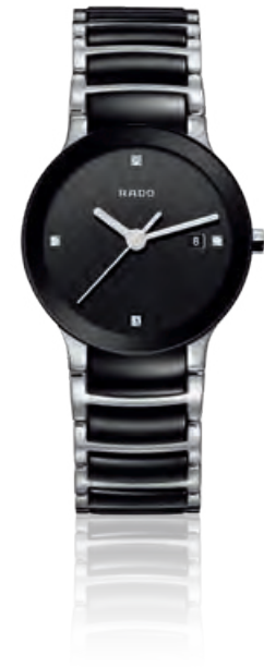
CENTRIX Hightech-Keramik, Edelstahl, Saphirglas, Datum, 4 Diamanten, Quarz · 1.320,- €