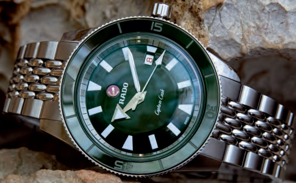
CAPTAIN COOK Edelstahl, Hightech-Keramik-Lünette, Saphirglas, Datum, Automatik, Größe 42 mm · 2.020,- €