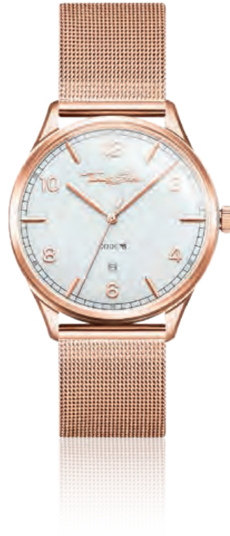
CODE TS ROSÉ GOLD Edelstahl PVD-beschichtet, Datum, Quarz · 239,- €