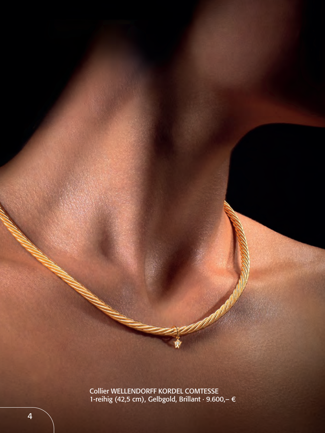
Collier WELLENDORFF KORDEL COMTESSE 1-reihig (42,5 cm), Gelbgold, Brillant · 9.600,- €