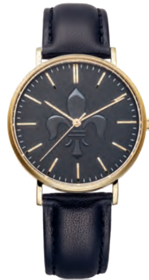
FULDA-Uhr 36MM Edelstahl, PVD beschichtet, Quarz · 89,- €