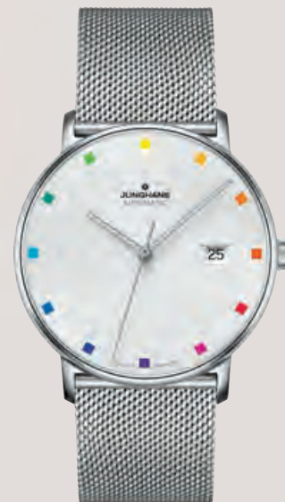
FORM A – 100 JAHRE BAUHAUS limitiert auf 1.000 Exemplare, Farbkreis von Johannes Itten, Edelstahl, Saphirglas, Sichtboden, Datum, Automatik · 870,- €