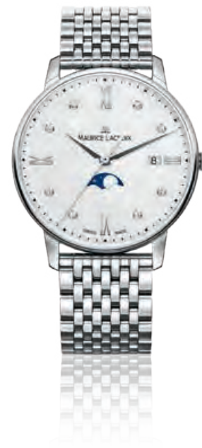
ELIROS MOONPHASE Edelstahl, Mondphasenanzeige, Zifferblatt mit 8 Diamanten, Saphirglas, Quarz · 995,- €