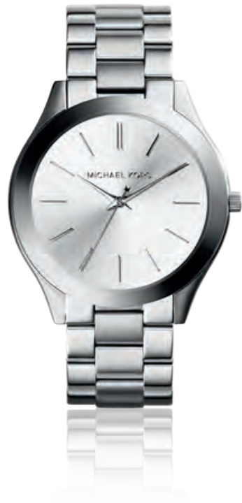
SLIM RUNWAY Edelstahl, Mineralglas, Quarz · 199,- €