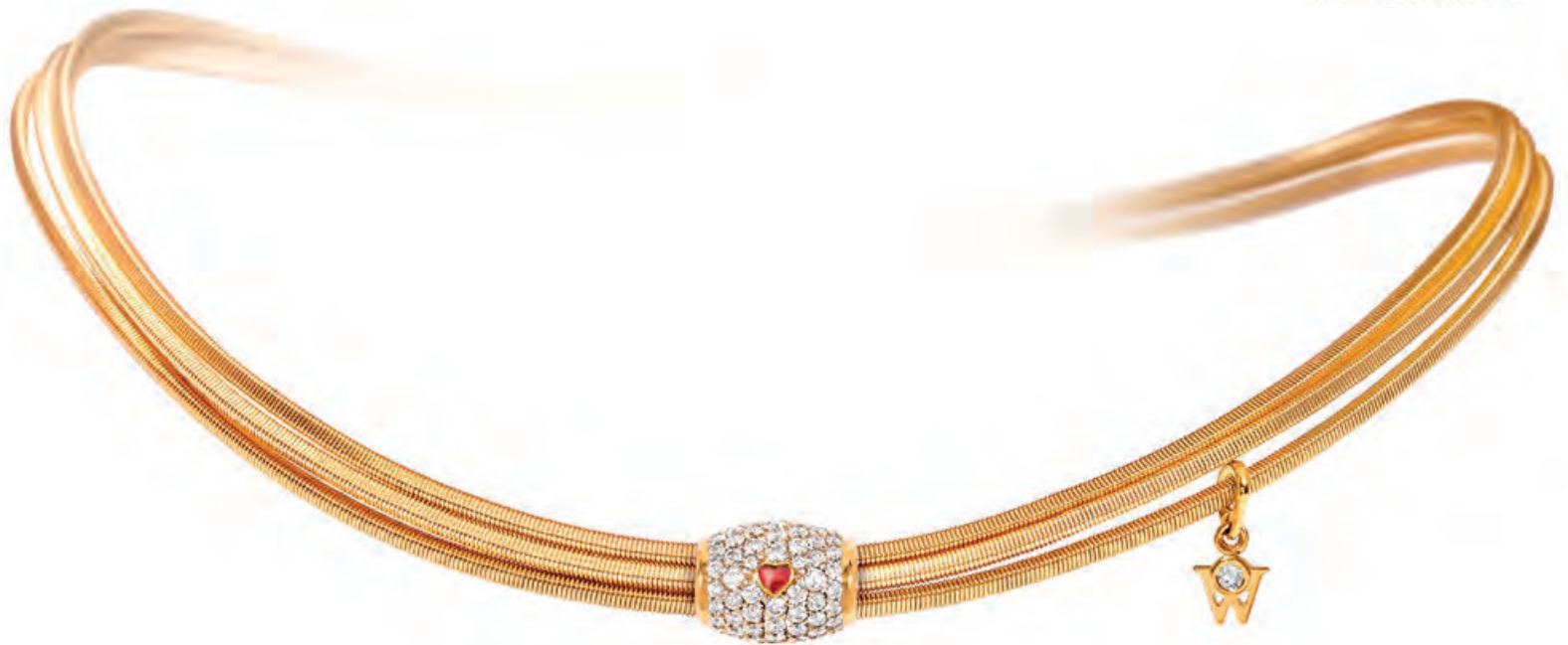
Ronde LIEBESERKLÄRUNG Gelbgold, Brillanten, farbige Kaltemaille · 12.400,- €