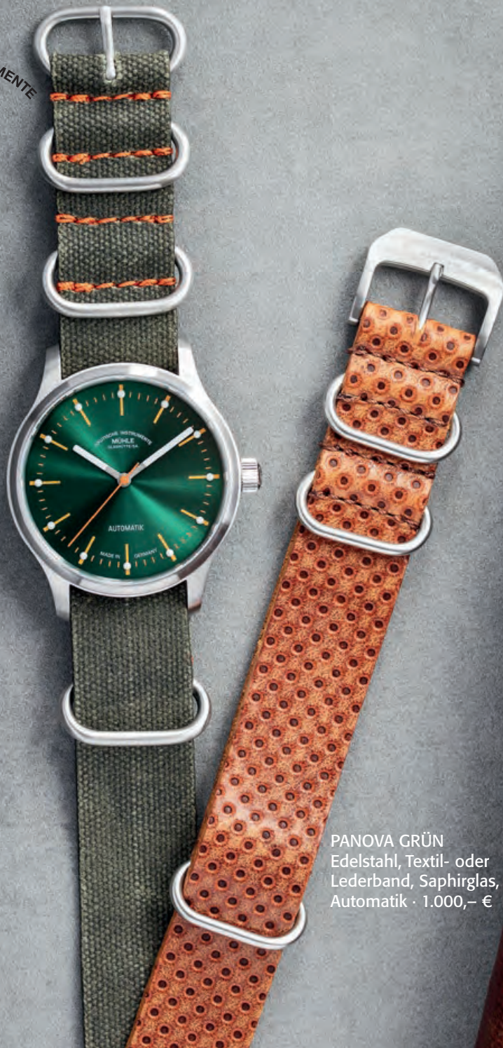
PANOVA GRÜN Edelstahl, Textil- oder Lederband, Saphirglas, Automatik · 1.000,- €

NAUTISCHE INSTRUMENTE MÜHLE GLASHÜTTE/SA.