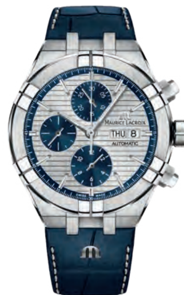
AIKON AUTOMATIC Chronograph, Edelstahl, blaues Kalbslederband, Saphirglas, Automatik · 2.690,- €