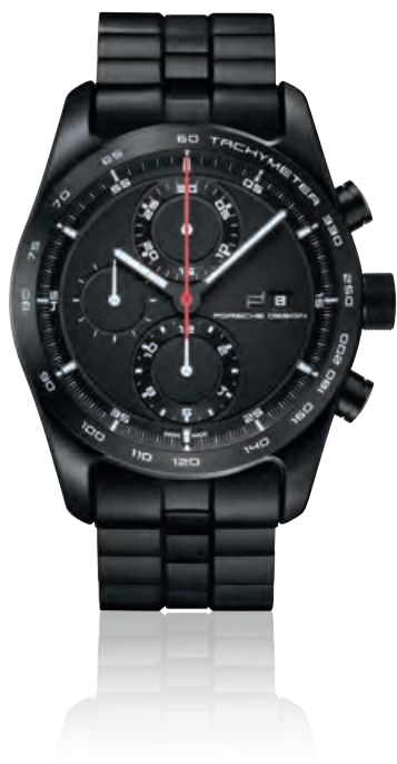
CHRONOTIMER KOLLEKTION POLISHED BLACK Chronograph, Titangehäuse und Titanband mit schwarzer Titancarbid- Beschichtung, Saphirglas, Automatik · 4.750,- €