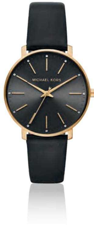
PYPER Edelstahl, Mineralglas, Quarz · 169,- €