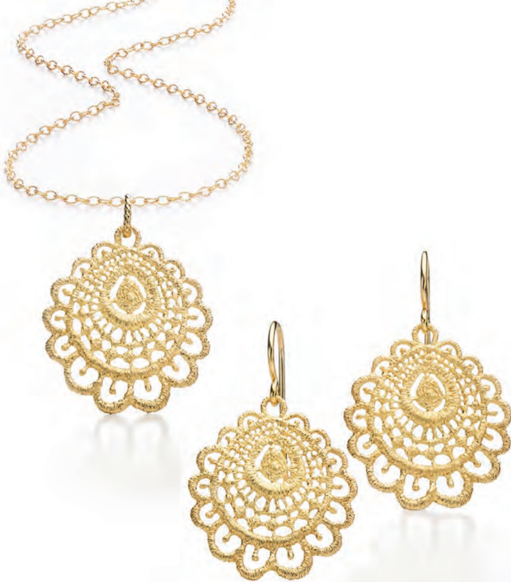
Anhänger ARATI, Gelbgold · 830,- € Ankerkette, Gelbgold, 45 cm · 840,- € Ohrhänger ARATI, Gelbgold · 1.660,- €

Viele Schmuckstücke von Brigitte Adolph sind jetzt auch in 925er Silber vergoldet erhältlich. Sprechen Sie uns an.