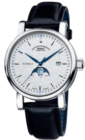
TEUTONIA IV MONDPHASE Edelstahl, Mondphase, Datum, Saphirglas, Automatik · 2.300,- €