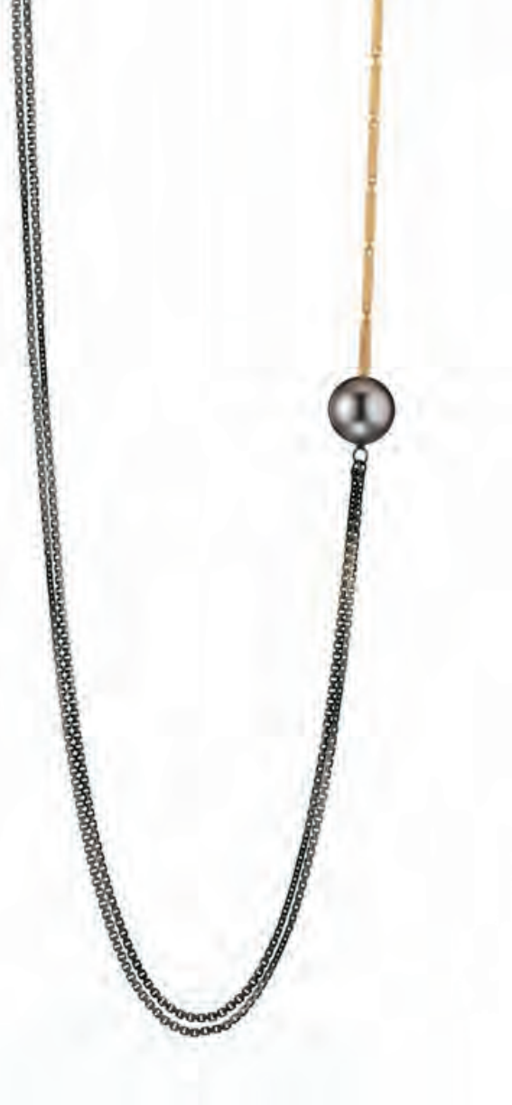
Collier FUSE BY JASMINA JOVY Tahitiperle 10–11 mm, Sterlingsilber · 525,- €