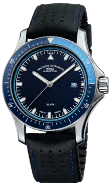
PROMARE GO Edelstahl, Datum, Saphirglas, Automatik · 1.890,- €