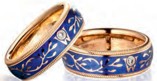
Ring VERGISSMEINNICHT Gelbgold, Brillant, farbige Kaltemaille, drehbar · 3.900,- €