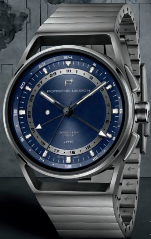
1919 GLOBE TIMER UTC Titan, Titanband, Saphirglas, Automatik · 6.450,- €