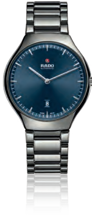
TRUE THINLINE Plasma-Hightech-Keramik, Saphirglas, Datum, Automatik · 2.520,- €