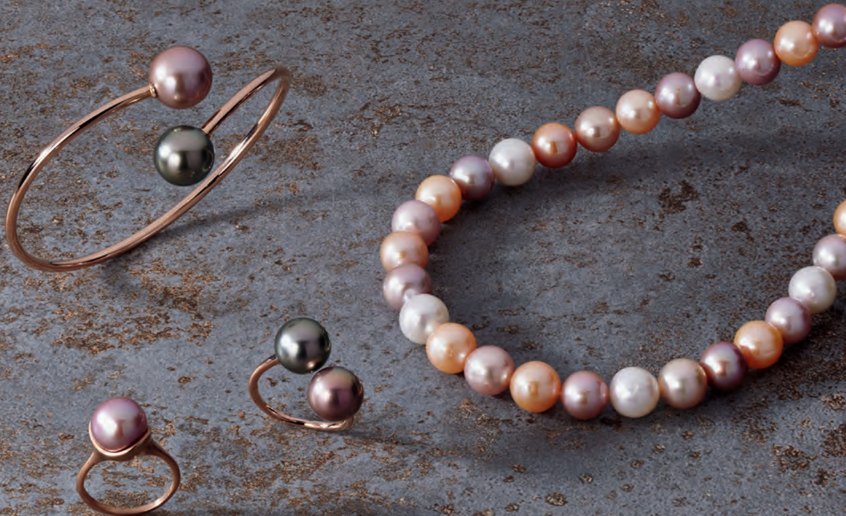
Armreif, 585er Roségold, Tahitiperle, Süßwasserperle „Ming“ 13–14 mm · 1.040,- € Ring, 585er Roségold, Süßwasserperle „Ming“ 10,5–11 mm · 1.030,- € Ring, 585er Roségold, Tahitiperle, Süßwasserperle „Ming“ 9–12 mm · 519,- € Collier, Süßwasserperlen „Ming“ 10–11,5 mm · 1.060,- €