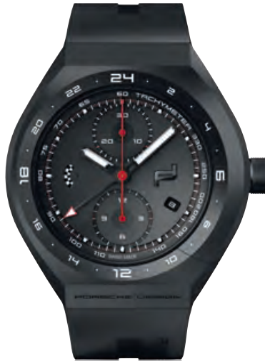
MONOBLOC ACTUATOR COLLECTION 24h-Chronometer Black & Rubber, Titanium, schwarzes Kautschukband mit Laser-Flex- Profil, Saphirglas, Automatik · 6.250,- €