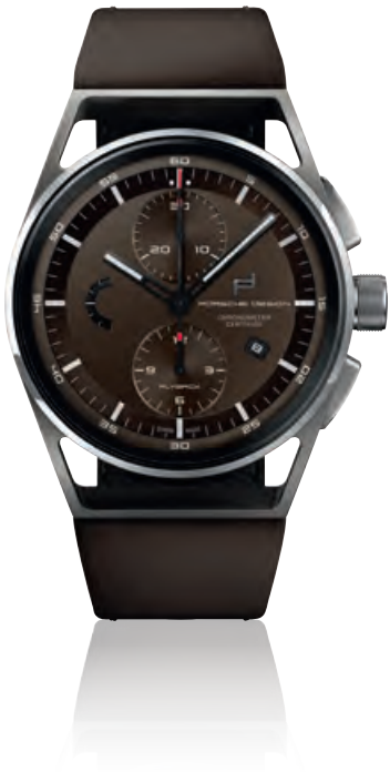
1919 CHRONOTIMER FLYBACK BROWN & LEATHER Titan, braunes Kalbslederband, Saphirglas, Automatik · 5.950,- €