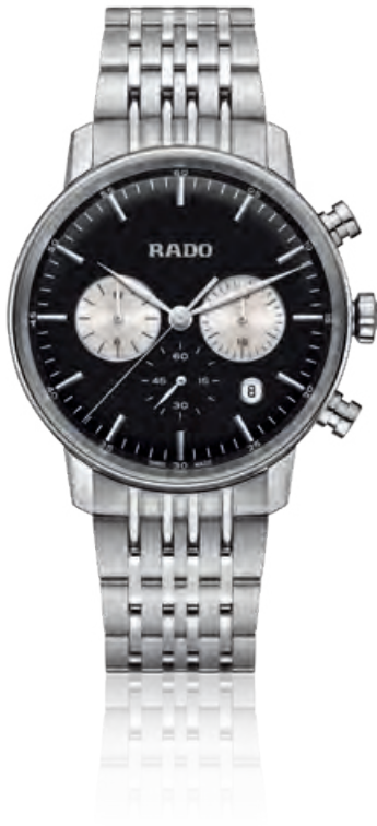
COUPOLE CLASSIC Chronograph, Edelstahl, Saphirglas, Datum Quarz · 1.460,- €