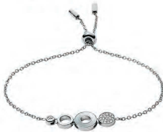
OPEN DISC Edelstahl, Zirkonia Collier · 49,- € Armband · 49,- €