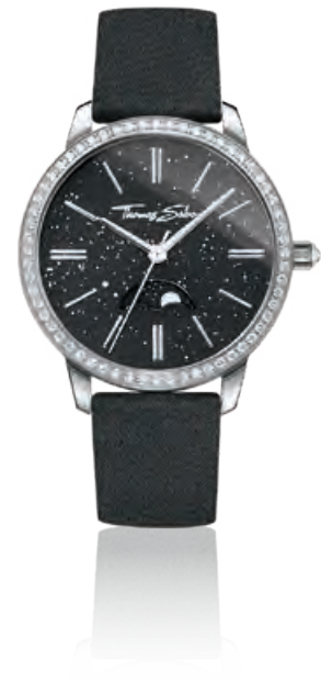
GLAM SPIRIT MOONPHASE Edelstahl, Mondphase, Zirkonia, Quarz · 279,- €