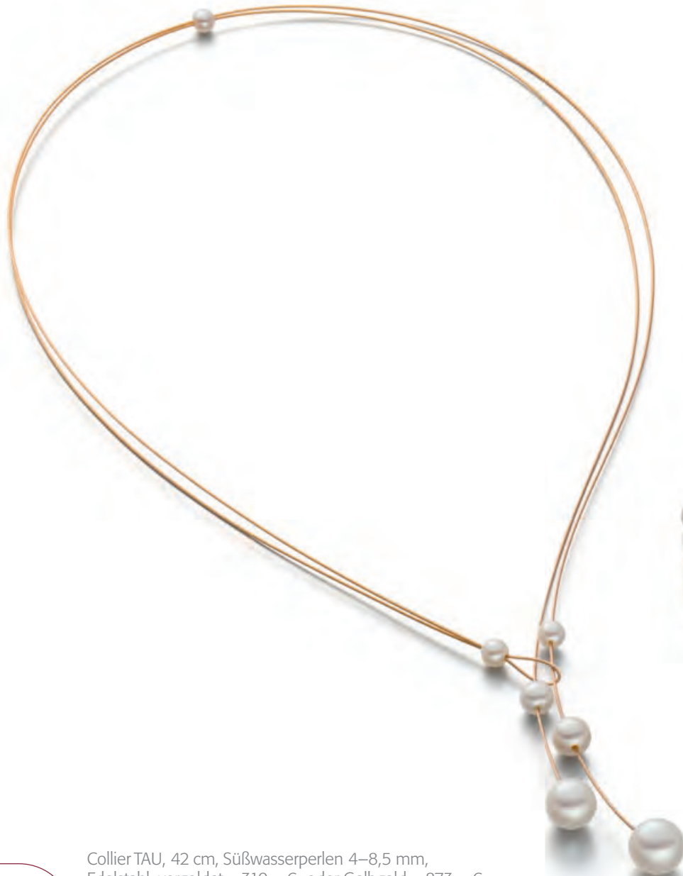
Collier TAU, 42 cm, Süßwasserperlen 4–8,5 mm, Edelstahl, vergoldet · 310,- € oder Gelbgold · 873,- €