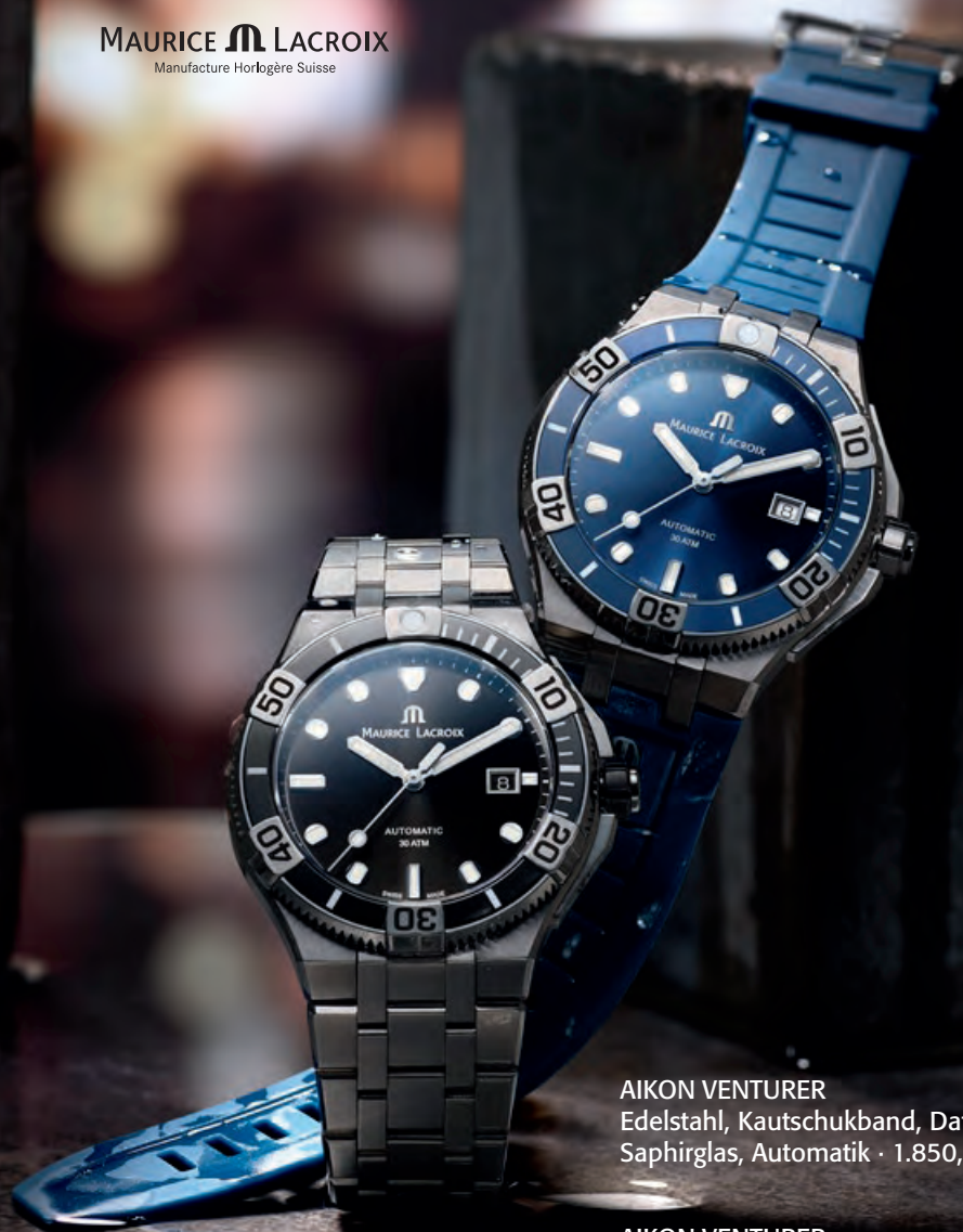
AIKON VENTURER Edelstahl, Kautschukband, Datum, Saphirglas, Automatik · 1.850,- €