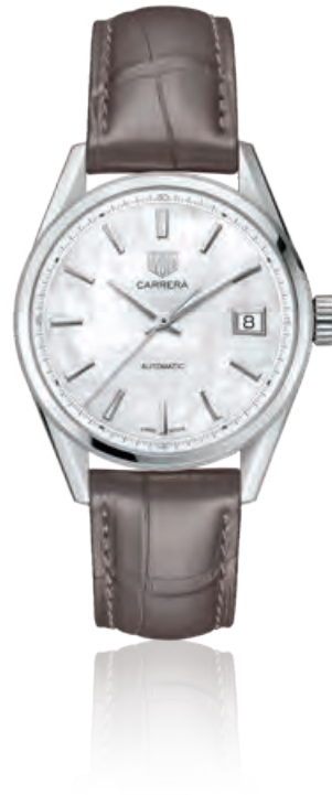
TAG HEUER CARRERA CALIBRE 5 LADY Edelstahl, Saphirglas, Datum, Automatik · 2.350,- €