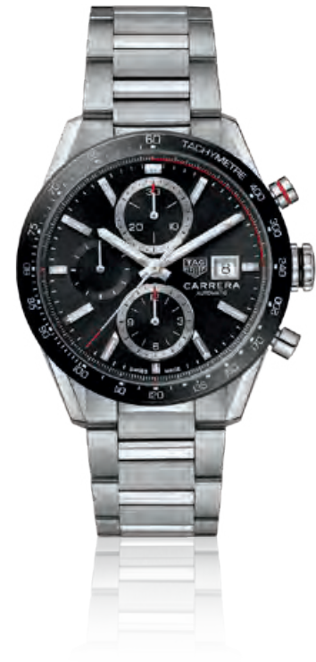
TAG HEUER CARRERA CALIBRE 16 Chronograph, Edelstahl, Saphirglas, Datum, Automatik · 4.050,- €