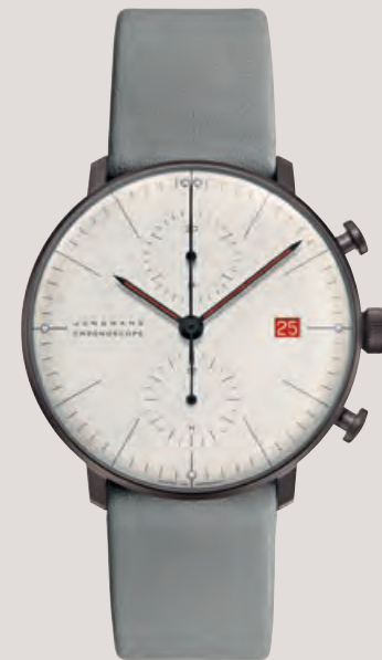
MAX BILL CHRONOSCOPE – 100 JAHRE BAUHAUS limitiert auf 1.000 Exemplare, Chrono- graph, Anthrazit-PVD-Beschichtung auf Edelstahl, Saphirglas, Sichtboden, Datum, Automatik · 1.995,- €