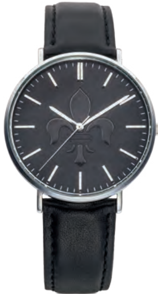
FULDA-Uhr 41MM Edelstahl, Quarz · 79,- €

Die Fulda-Lilie, symbolisch für die drei Schutzpatrone Simplizius, Faustinus und Beatrix, hat sich zum prägnantesten Symbol der Barockstadt entwickelt und ziert die neueste Fulda-Uhr aus dem Hause Bott. Die Fulda-Lilie ist flächig geprägt und glänzt auf mattschwarzem Grund. Mit 41 mm Durchmesser ist die Uhr mit dem silber glänzenden Edelstahlgehäuse sowohl für Damen als auch für Herren tragbar. Sie punktet mit robustem Gehäuse, hochwertigem Quarzwerk, Mineralglas und einer Wasserdichtigkeit von 5 ATM.