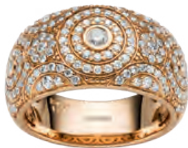
Kette, 3-reihig, 45 cm, Roségold · 1.400,- € Anhänger, Roségold, Brillanten 1,39 ct · 6.900,- € Ring, Roségold, Brillanten 1,27 ct · 7.950,- €