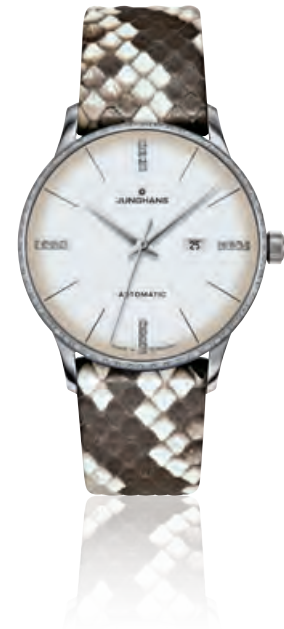
MEISTER DAMEN AUTOMATIC Edelstahl, Saphirglas, Datum, Diamant-Indizes und -Lünette · 1.890,- €