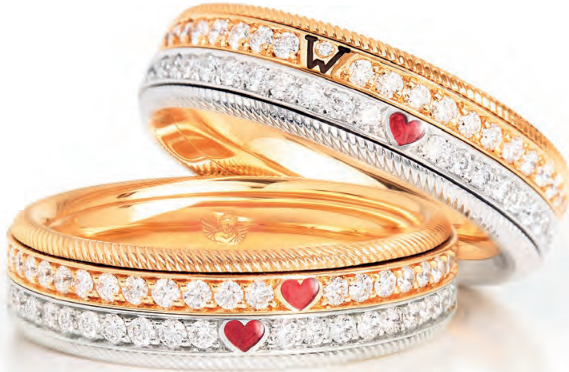
Ringe ZWEI HERZEN. EINE LIEBE. Weißgold, Gelbgold, Brillanten, farbige Kaltemaille, drehbar · 16.800,- €