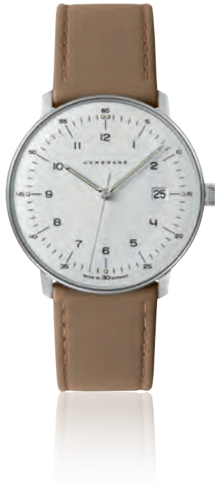
MAX BILL QUARZ Edelstahl, traditionelles Hartplexiglas, Datum · 495,- €