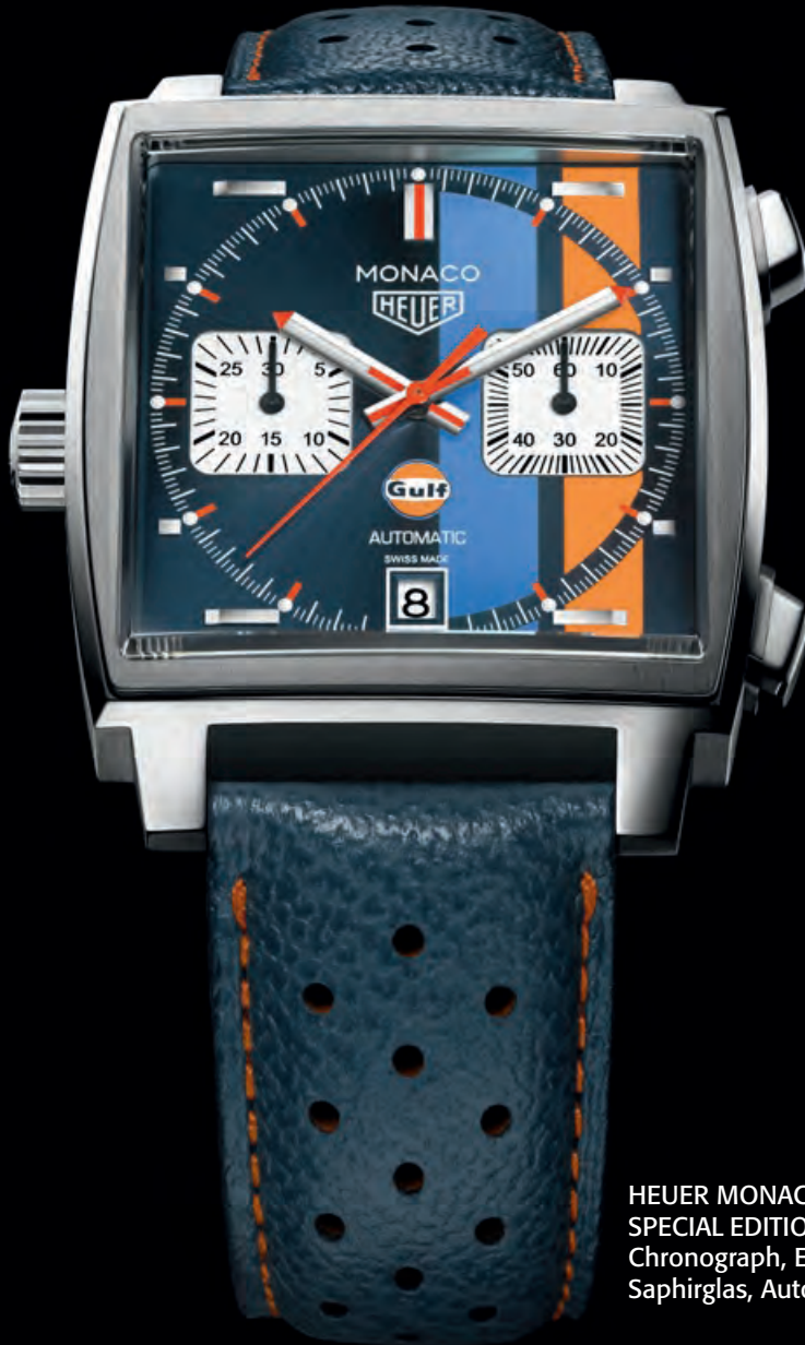
HEUER MONACO CALIBRE 11 SPECIAL EDITION Chronograph, Edelstahl, Saphirglas, Automatik · 5.250,- €