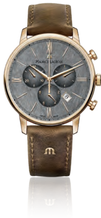
ELIROS CHRONOGRAPH Chronograph, Edelstahl PVD- beschichtet, Lederband braun vintage, Saphirglas, Quarz · 895,- €