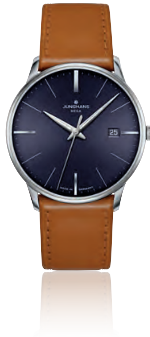
MEISTER MEGA neueste Funkwerkegeneration, Edelstahl, Hartplexiglas, Datum, Quarz · 890,- €