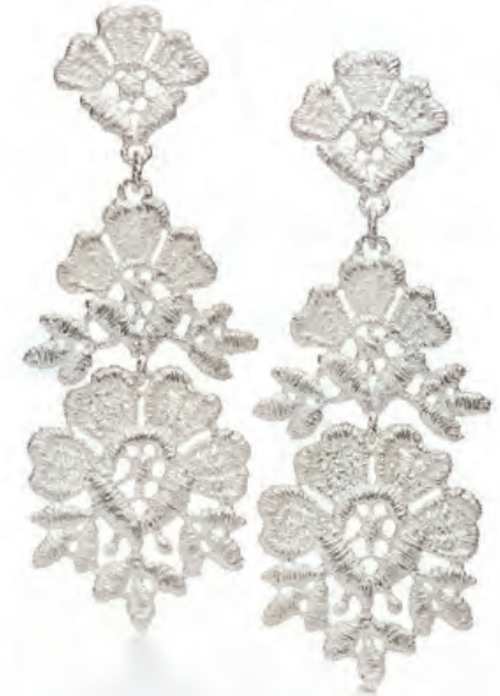
Ohrhänger ANTHEA, Silber · 460,- €

Viele Schmuckstücke von Brigitte Adolph sind jetzt auch in 925er Silber vergoldet erhältlich. Sprechen Sie uns an.