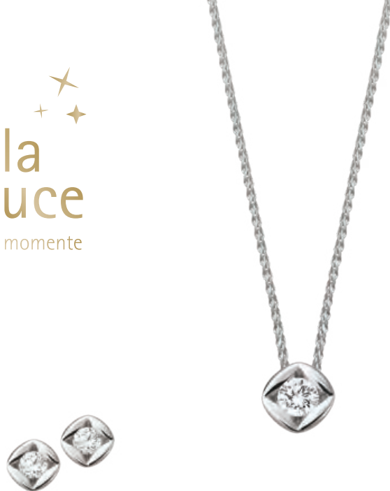
Collier, 585er Weißgold, Brillant 0,10 ct · 465,- € Ohringe, 585er Weißgold, Brillanten 0,10 ct · 389,- € Ring, 585er Weißgold, Brillant 0,10 ct · 469,- €