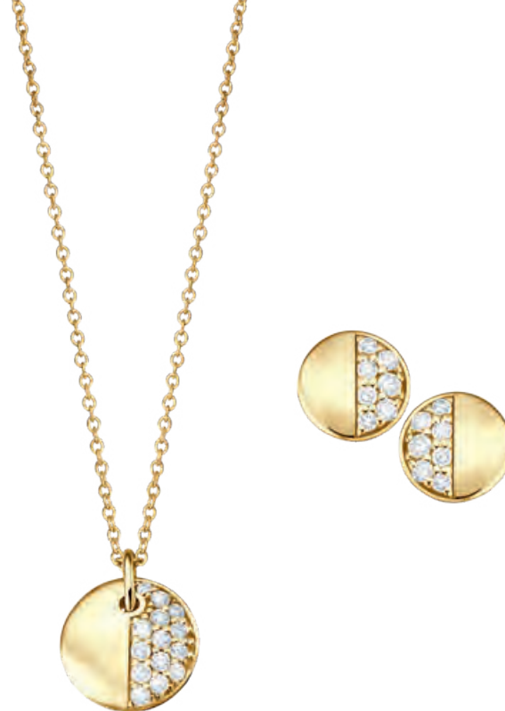
Collier, 45 cm, 585er Gelbgold, Brillanten 0,15 ct · 759,- € Ohringe, 585er Gelbgold, Brillanten 0,16 ct · 539,- € Ring, 585er Gelbgold, Brillanten 0,08 ct · 515,- €