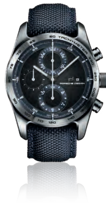
CHRONOTIMER KOLLEKTION DEEP BLUE Chronograph, Titangehäuse, dunkelblaues Hightech-Gewebe- band, Saphirglas, Automatik · 3.950,- €