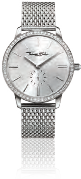
GLAM SPIRIT Edelstahl, Quarz · 279,- €