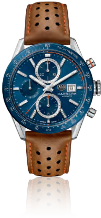
TAG HEUER CARRERA CALIBRE 16 Chronograph, Edelstahl, Saphirglas, Datum, Automatik · 3.900,- €