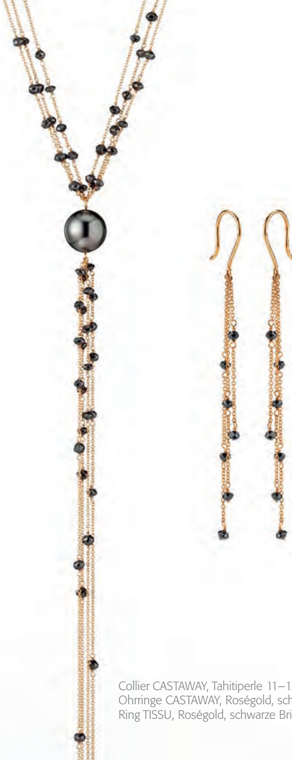
Collier CASTAWAY, Tahitiperle 11–12 mm, Roségold, schwarze Brillanten · 3.300,- € Ohringe CASTAWAY, Roségold, schwarze Brillanten · 795,- € Ring TISSU, Roségold, schwarze Brillanten · 2.400,- €