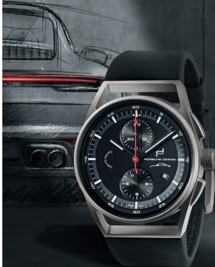
911 CHRONOGRAPH TIMELESS MACHINE LIMITED EDITION Titan, schwarzes Porsche Fahrzeuglederband, Saphirglas, Automatik · 4.911,- €