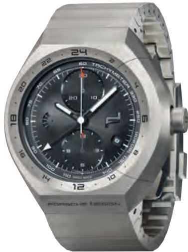
MONOBLOC ACTUATOR COLLECTION GMT-Chronometer All Titanium, Titan- band, Saphirglas, Automatik · 6.450,- €