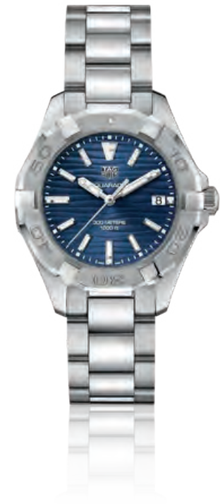
TAG HEUER AQUARACER 300M LADY Edelstahl, Saphirglas, Datum, Quarz · 1.550,- €