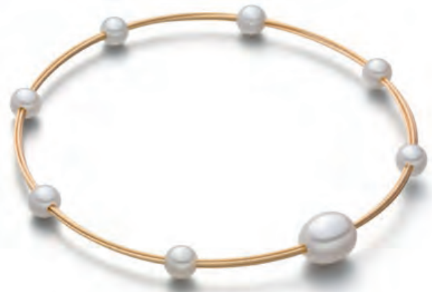
Ohrstecker MINI-TRIO, Süßwasserperlen je ca. 4 mm, Silber, vergoldet · 208,- € Ring MINI-TRIO, Süßwasserperlen 3, 5 und 6 mm, Gelbgold · 460,- € Armreif, eine ovale und sieben runde Süßwasserperlen, Edelstahl, vergoldet · 180,- €