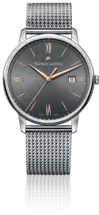
ELIROS DATE Edelstahl, Datum, Milanaisband, Saphirglas, Quarz · 650,- €