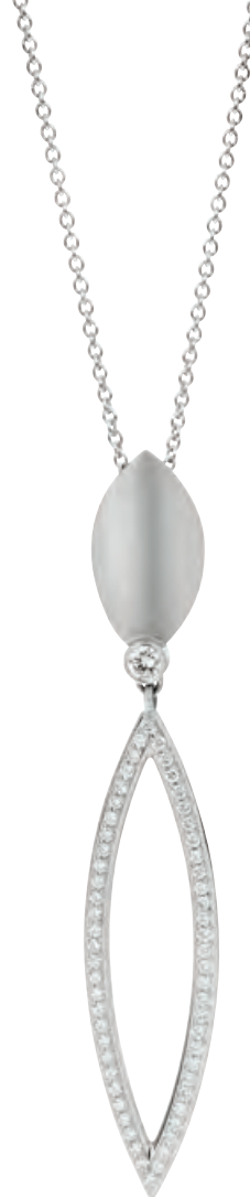
Collier, Platin, Brillanten 0,17 ct · 1.160,- € Ohrringe, Platin, Brillanten 0,18 ct · 870,- €