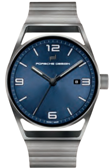
1919 COLLECTION DATETIMER ETERNITY BLUE Titanium, Titanband, Datum, Saphirglas, Automatik · 3.250,- €