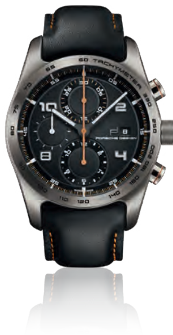
CHRONOTIMER KOLLEKTION TANGERINE Chronograph, Titangehäuse, schwarzes Kalbslederband, Saphirglas, Automatik · 3.950,- €