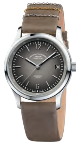
LUNOVA LADY Edelstahl, Datum, Saphirglas, Automatik · 1.650,- €