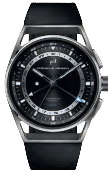
1919 GLOBE TIMER UTC Titan, schwarzes Kalbslederband, Saphirglas, Automatik · 5.950,- €