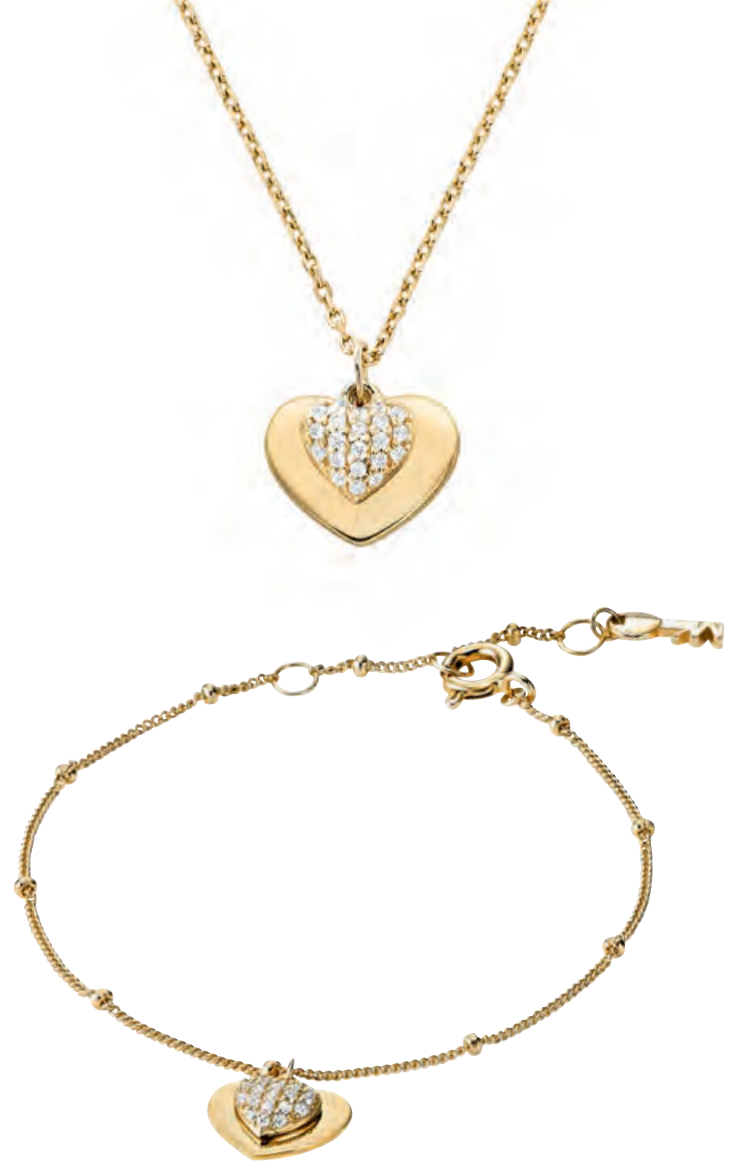
LOVE Silber, vergoldet, Zirkonia Collier · 129,- € Armband · 129,- €