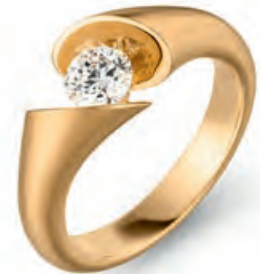
Collier, Gelbgold, Brillant 0,25 ct · 2.800,- € Ohrstecker, Gelbgold, Brillanten 0,36 ct · 2.950,- € Ring, Gelbgold, Brillant 0,15 ct · 2.100,- €