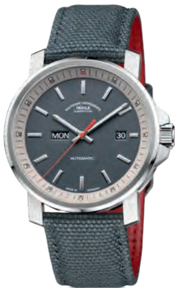
29ER TAG/DATUM Edelstahl, Tag, Datum, Textilband, Saphirglas, Automatik · 1.490,- €